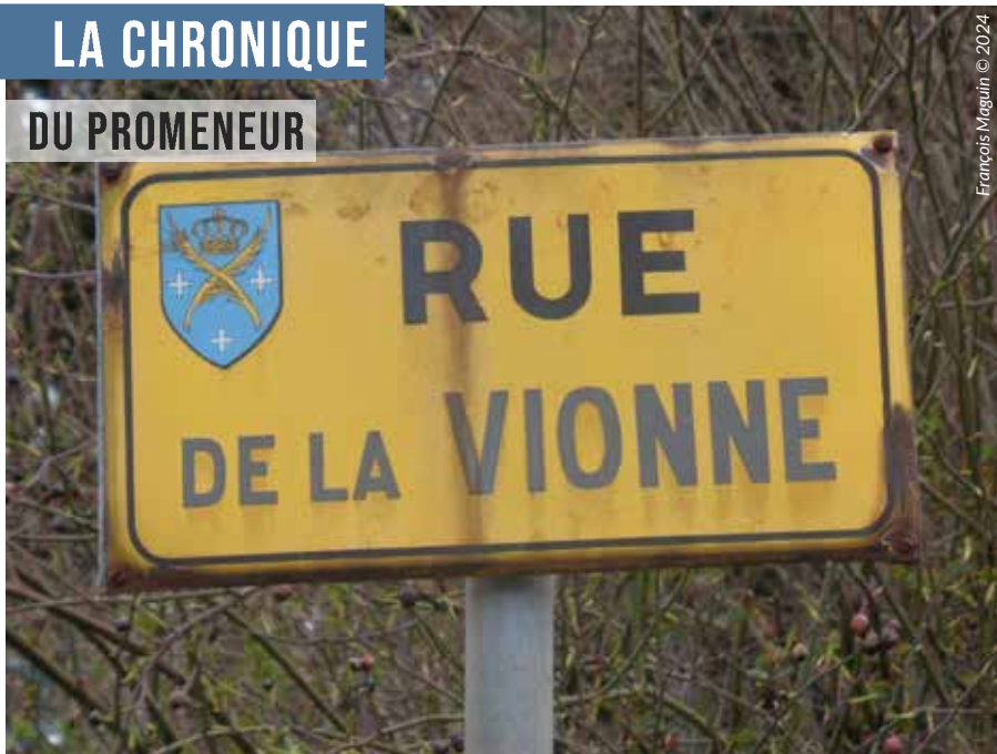
François Maguin © 2024