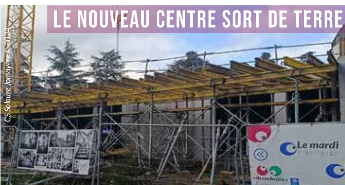
CS Solore - Jomayère © 2024